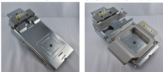
Vrije arm montagemal zonder & met PRMF50

Artikel Nr: PRFMJ1 Leverbaar: Mei 2018 Adv. verk.prijs: € 149,00 (Incl. BTW)