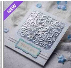
Kaart met embossing