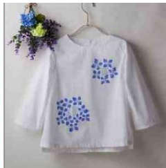
Hydrega bloem stencil op blouse