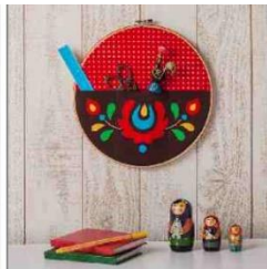
Opbergdecoratie in borduuring

Vaderdag inspiratie! Direct aan de slag 😊