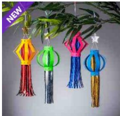
Star festival ornament

Onlangs zijn er weer 10 nieuwe gratis projecten toegevoegd aan de gratis online Canvas Workspace applicatie: