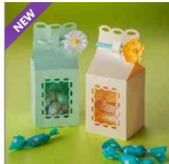
Cadeaudoosje melkkoek vorm