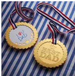
Beste vader medaille